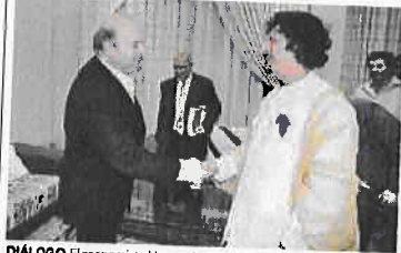
DIALOGO. El economista Hernando de Soto y el jefe del Estado de Libia, Muamar Gadafi dialogaron sobre la crisis y sus efectos en el mundo.