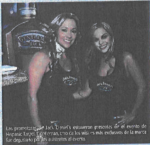
Las promotoras de Jack Daniel's estuvieron presentes en el evento de Hispanic Target. Gentleman, uno de los whiskies más exclusivos de la marca fue degustado por los asistentes al evento.

Los sponsors que hicieron posible este evento de "5ta. Entrega de la Portada Hispanic Target" fueron: DRRT, Avaya, Remos, León Medical Center, Conrad Miami, G & D Developers, Flor De Caña, Jack Daniel's, MEGATV, ABICC, Shape Lovers, In Dolce, Silva Heeren, Pilsen, KGFA Capital Partners, Copa Airlines, Lulinski & Associates y Patagonia Dulce.