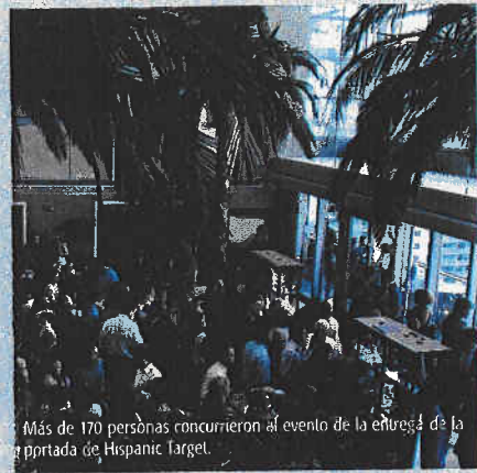
Más de 170 personas concurren al evento de la entrega de la portada de Hispanic Target.