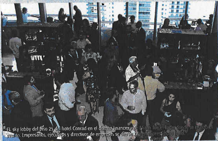
El sky lobby del piso 25 del hotel Conrad en el distrito financiero de Miami fue el lugar donde se realizó el evento. Empresarios, ejecutivos y directivos de empresas se dieron cita en el prestigioso hotel.