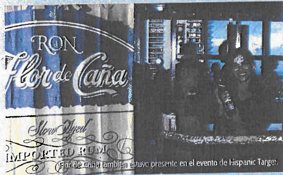
Flor de Caña también estuvo presente en el evento de Hispanic Target.